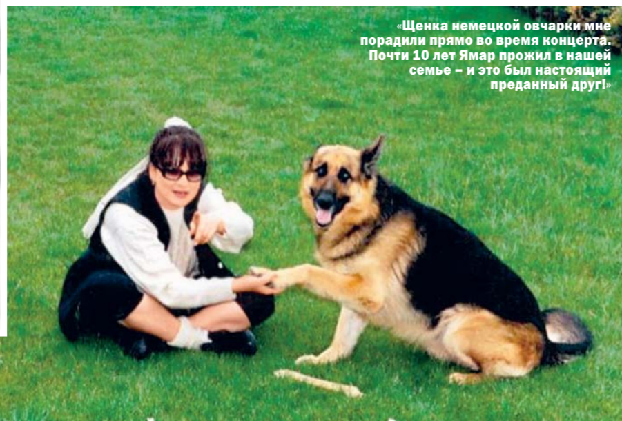
«Щенка немецкой овчарки мне порадили прямо во время концерта. Почти 10 лет Ямар прожил в нашей семье – и это был настоящий преданный друг!»