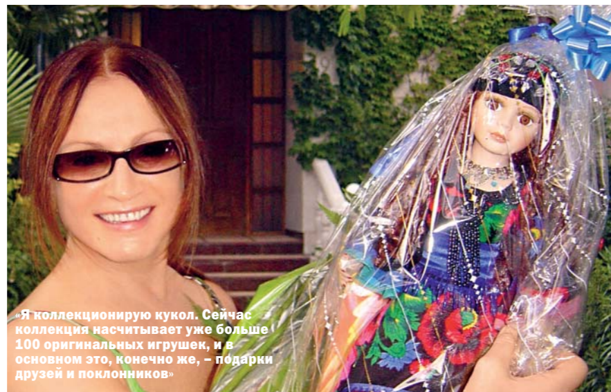
«Я коллекционирую кукол. Сейчас коллекция насчитывает уже больше 100 оригинальных игрушек, и в основном это, конечно же, – подарки друзей и поклонников»