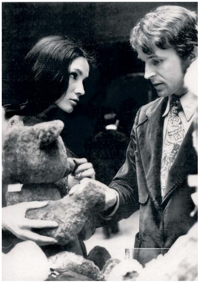
«Мои поклонники со всего СНГ дарят много приятных подарков: плюшевые игрушки, цветы, сладости»